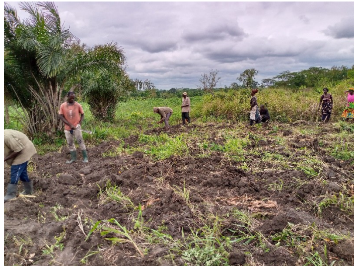
SEMI DU MAIIS

Le semis du maïs a eu lieu le 8 septembre 2022. Un semis manuel à raison de deux graines de maïs par poquet avec un schéma cultural de 80cm X 40 cm pour le maïs de variété ikéné qui a été observé sur trois parcelles avec la participation de 19 personnes dont 7 femmes et 12 hommes. Le semis du soja de variété TGX 1910-14F a eu lieu le 12 septembre 2022 avec un schéma cultural de 50cm fois 20 cm sur une parcelle de 625m 2 en raison de deux graines par poquet. Le semis du soja a vu la participation de 13 personnes dont 5 femmes et 8 hommes. On note aussi la présence des personnels de l'ONG IADES, trois personnels de l'ICAT dont le CAG, deux CTGEA et aussi la participation de quatre coopératives à ces différentes séances de semis.