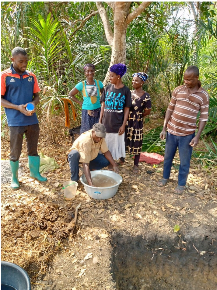
FABRICATION DU COMPOST DANS LA FOSSE

Pour fabriquer le compost à base de mycotrie ,nous devons utilisée des feuilles mortes(paille),les crottes d'animaux ,cendre, l'eau, mycotrie , branches de palmes ,arrosoirs ,bassines, coupe-coupe ,leucena ,les pailles de riz, les fientes et fourches. C'est dans cet ordre d'idée que les personnels de l'ICAT Avé ont appris aux producteurs du village d'ABLAME la fabrication du compost et le retournement des éléments constitutifs après chaque trois jours jusqu'à leur décomposition . On note une faible participation des producteurs.