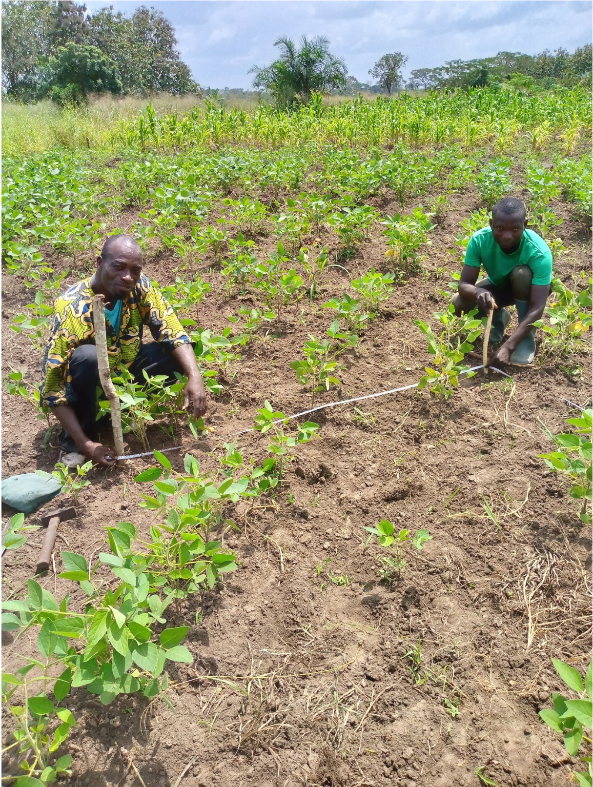
POSE DU CARRE DE RENDEMENT